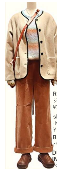
RESPIGHI. ジャケット ¥15400 shou should. セーター ¥16280 BL BEAU LINE パンツ ¥14080 DUG standard INCIPIT. バック ¥15400 energy シューズ ¥10780