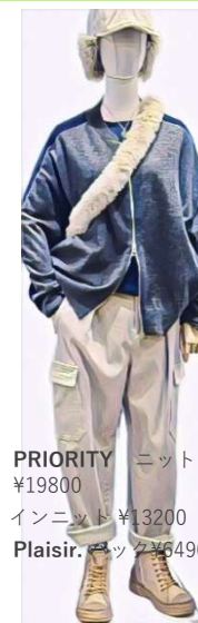
PRIORITY ニット プルゾン ¥19800 インニット ¥13200 Plaisir. バック ¥6490 帽子. ¥5390 +++&G ganosch パンツ ¥17600 Monet ブーツ ¥22000