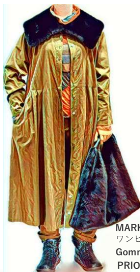
MARK AND PLUS +2 ワンピ ¥25300 Gomme ドットT ¥22000 PRIOTY ティベット ¥8580 バック ¥13200 BL BEAU LINE ダウン パンツ ¥10890 energy. ブーツ ¥11880