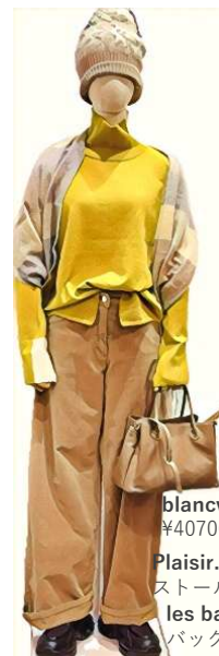
blancvert ニット ¥40700 Plaisir. カシミア ストール ¥19800 les basiques バック ¥35200 1970 SEVENTY パンツ ¥52800 NO NAME シューズ ¥35200