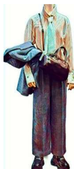
LIVANA CONTI ジャケット ¥13200 LIVANA CONTI パンツ ¥72600 MARELLA シャツ ¥41800 les basique バック ¥33000 NO NAME シューズ ¥34100