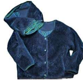
トイプーポアジャケット ¥63800