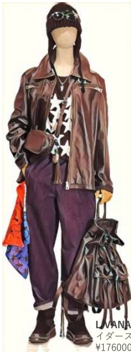
LIVANA CONTI ライダースジャケット ¥176000

Plaisir ニット帽 ¥4290 gomme ピックシルエットT ¥13200 Tre BarraBi デニム ¥48600 DUG standard INCIPIT バック ¥41800 バック ¥16500 energy ムートンブーツ ¥28380 Gabor シューズ ¥33000