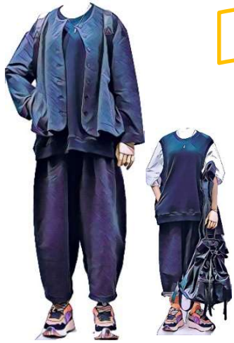
MARK AND PLUS +2 ジャケット¥22000 ベスト¥12100 パンツ ¥22000 SEVENTRY 1970 白_T. ¥38500 DUG standard INCIPIT リュック¥41800 NO NAME シューズ ¥35200