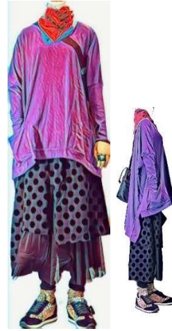
gomme カットソー¥20900 gomme. ドッキング スカート¥30800 NO NAME シューズ¥27600