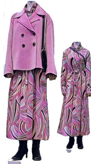
iBLUES ピーコート ¥88000 ワンピース ¥67100 バッグ¥28700