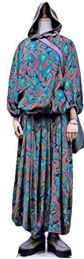
GOKI. プルオーバー¥20900 GOKI. スカート¥26400 blancvert フードT ¥31900 [50%OFF] energy ショートブーツ ¥14300