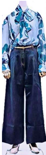
iBLUES ブラウス¥42900 MARELLA. デニム¥37400 SALON DE GRES ¥28600