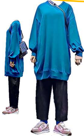
gomme ロングスエット¥16500 MARK AND PLUS +2デニム¥20900 les basiques バック¥38500 NO NAME シューズ ¥26400