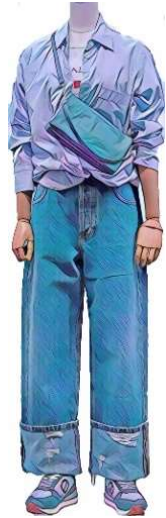
SEVENTY 1970 シャツ ¥49500 blancvert. Tシャツ ¥17500