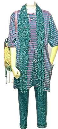
ボーダーチュニックT ¥10800 レースストール ¥5900 デニム ¥14800