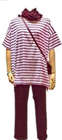
チュニックポーター ワンピース ¥10000 パンツ ¥9800