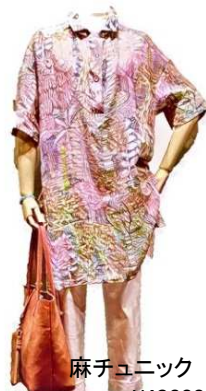
麻チュニック ¥43000 デニム ¥15000