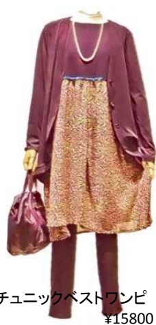
チュニックベストワンピース ¥15800