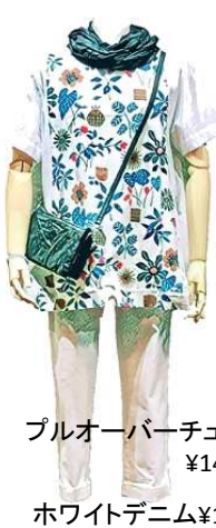
ブルオーバーチュニック ¥14800