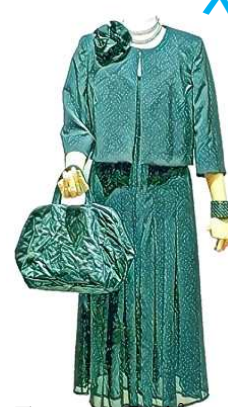
フォーマルワンピース ¥60000 ジャケット ¥66000