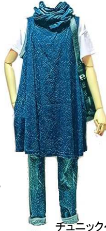
チュニックベスト ¥14800 デニム ¥14800