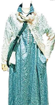
PORT-BLAIR レースカーディガン ¥9800