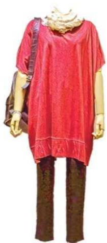
オフショルダー カットチュニック ワンピース ¥14800 パンツ ¥9800