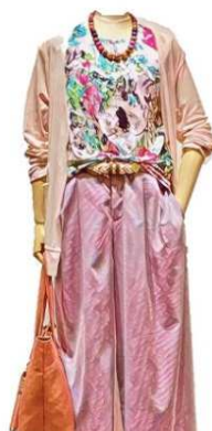
カーディガン ¥6900 花柄 ランニング ¥5900 giacca カウチヨ ¥16800