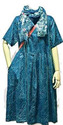
linen cotton ワンピース ¥22000