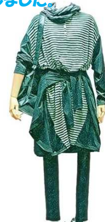
初秋物 giacca カットワンピース ¥13800