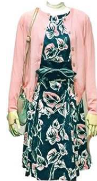
コットンカーディガン ¥13000 vivapresto ワンピース ¥27000