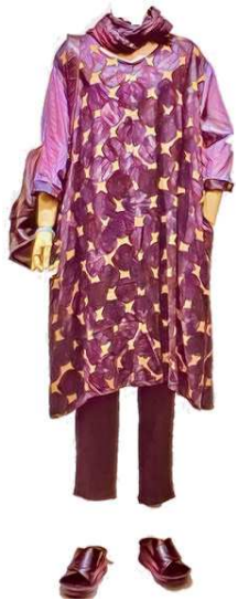
linenドッキングワンピース ¥21000