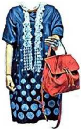
ワンピース ¥29,000 バック ¥29,000