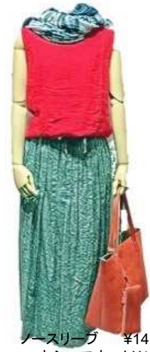
ノースリーブ ¥14,000 マキシ〜スカート ¥14,800