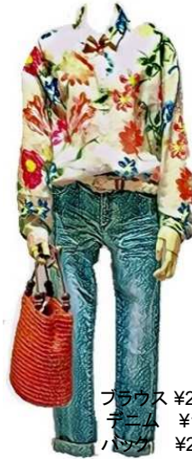
ブラウス ¥29,000 デニム ¥14,800 パンツ ¥26,000