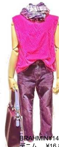
BRAHMIN ¥14,000 デニム ¥16,800 バック ¥12,000