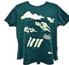
雲Tショートライン ガウチョコーデにお勧め