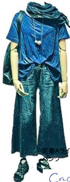
定番AラインT ¥5,600 パンツ ¥17,000