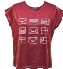
ヒサシスリーブ ターT ¥3,200