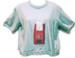
ベリーショートT Lesson 1