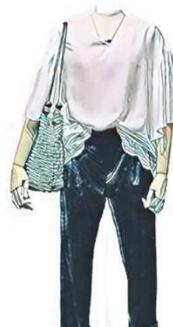
ブラウス ¥14,000 パンツ ¥14,000