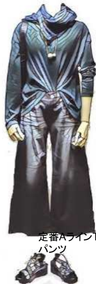
定番AラインT ¥5,900 パンツ ¥17,000