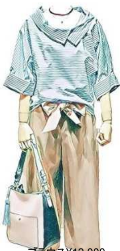
ブラウス¥12,000 ガウチョ¥16,000